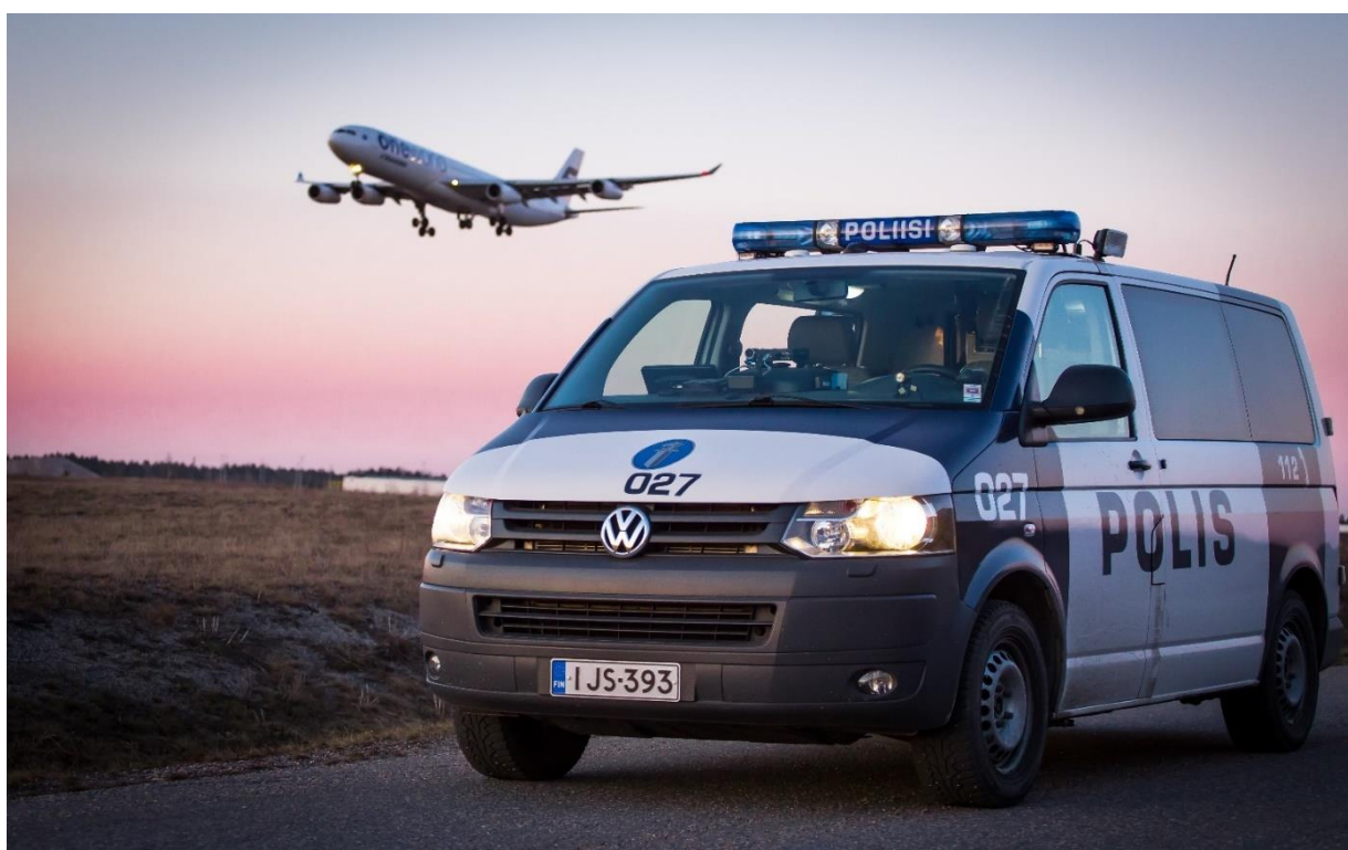
Kuva 5 Poliisin tietoon tulee vain osa liikenne rikkomuksista. Liikenteessä liikkuja voi omalla asianmukaisella käytöksellään lisätä liikenteen turvallisuutta ja kanssaihmisten turvallisuudentunnetta.

https://www.poliisi.fi/liikenneturvallisuus