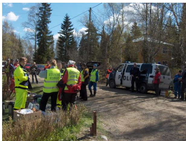
Kuva 6 SPR:n kautta voidaan kanavoida ja koordinoita monenlaista auttamistoimintaa.

Osaston jäsenillä on mahdollisuus kouluttautua henkisen ensiavun antamiseen, kuten myös turvapaikan hakijoiden kanssa toimimiseen. Helsingin ja Uudenmaan piirin toimesta koulutukset voidaan järjestää pikaisellakin aikataululla. Jonkin verran on myöskin osastolle tullut kyselyjä ko. toimintaan osallistumisesta - suomalainen haluaa kuitenkin lähtökohtaisesti aina auttaa.