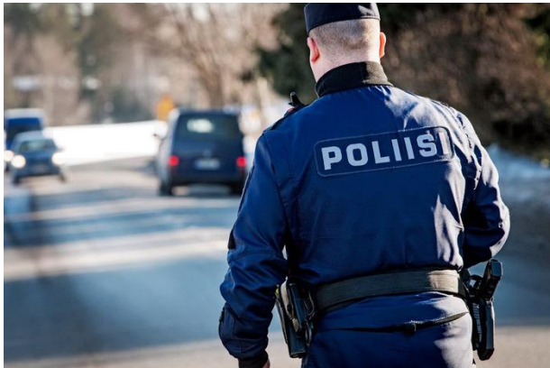
Kuva 3 Liikenteen turvallisuuden lisäämisessä tarvitaan viranomaisten lisäksi myös yksityisten tahojen ja kolmannen sektorin panosta.

Koettu liikenneturvallisuuden parantuminen vaikuttaa ihmisten elämänlaatuun ja hyvinvointiin, elinympäristöjen viihtyisyyteen ja liikkumisvalintoihin.