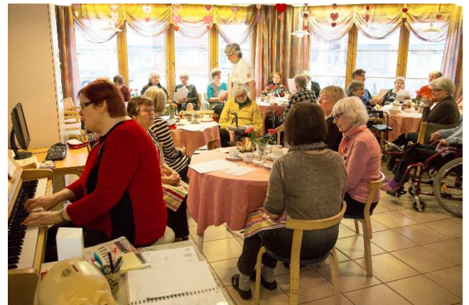
Kuva 8 Hyvän Tuulen Tuvilla eri puolilla Tuusulaa kokoontaan juttelemaan, laulamaan ja kahvittelemaan. Tuvilla toimivat vapaaehtoiset isännät ja emännät.