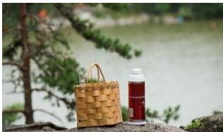
Kuva 2.

Turvallisuus ja turvallisuuden tunne syntyvät monen asian yhteisvaikutuksesta, ja monen toimijan yhteistyön tuloksena. Panoksensa ja arvokkaan näkemyksensä ovat antaneet yksittäiset kuntalaiset, kehittämistoimikunnat, kunnan eri toimijat, sekä viranomaiset ja yhteisöt.