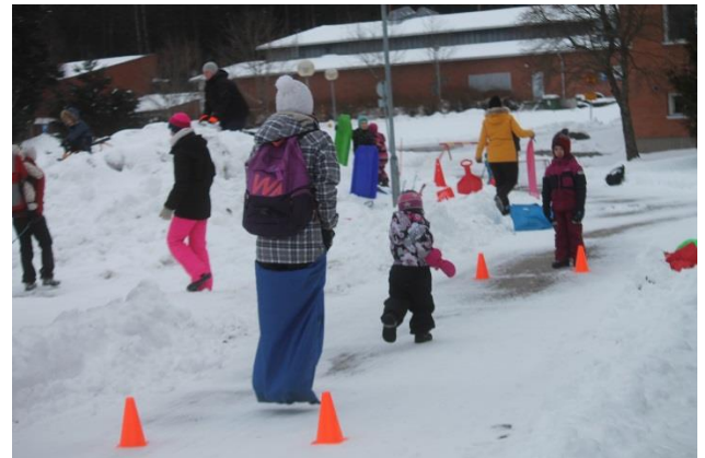
Kuva 7 Seurakunnan kaikille avoin liikkuva perhekerho tarjoaa toimintaa koko perheelle.